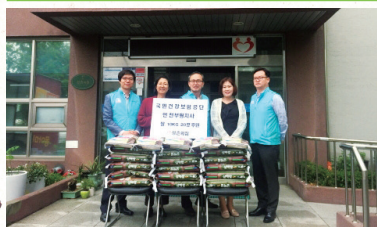
한국인의 든든한 주식 쌀