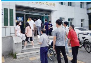
이용가족들의 소중한 한표를 위한 발걸음

늘 아낌없는 사랑과 나눔을 실천하시는 좋은친구들 여러분 앞으로도 성촌과 함께 가치 있는 삶을 만들어 가는 행복공동체를 함께 만들어 가요~