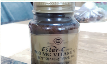
건강관리를 위한 비타민