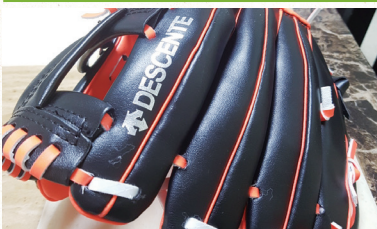
신바람 나는 야구용품