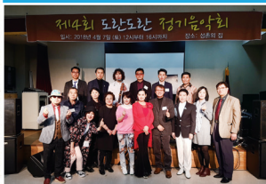
이용가족과 함께 하는 신나는 노래, 음악 공연