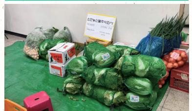
이용가족들의 맛있는 김치