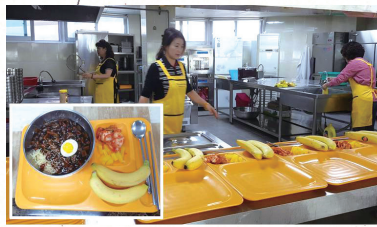
한국인의 페이버릿 자장면