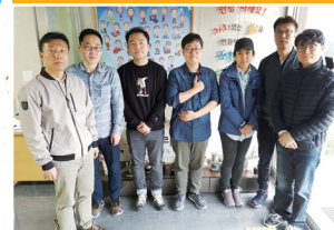
맑고 깨끗한 환경 만들기 프로젝트1