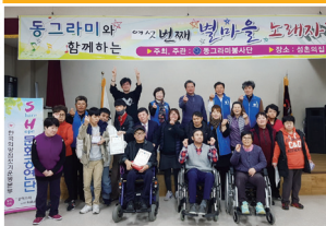
신바람 나는 노래자랑