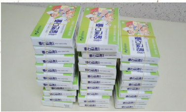
기생충 감염 방지를 위한 구충제