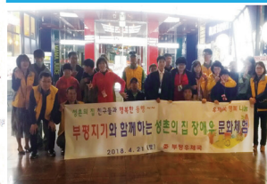
재미와 감동이 넘치는 영화관람